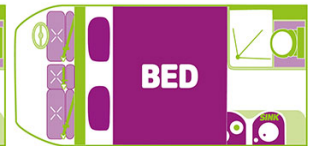
FLOOR PLAN NIGHT (LOWER LEVEL)