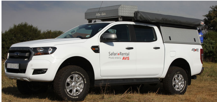
Group L : Luxury Camper Sleep View: 1 Roof-top Sleep Cabin Linen & Towels Supplied 2 sleeper configuration