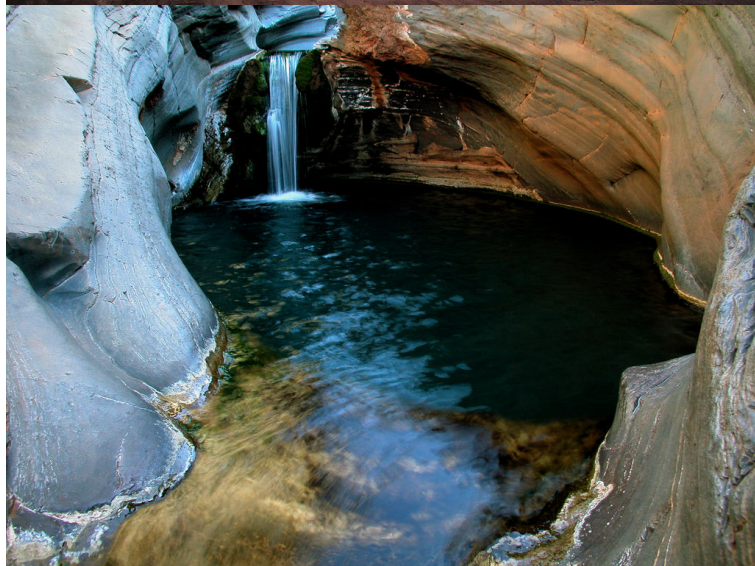
Karijini National Park_

Le lendemain, partez pour le Karijini National Park : une sorte d'oasis en plein désert. Il s'agit du 2 e plus grand parc