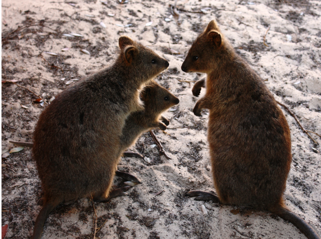
Quokka family in Rottnest Island_

Ensuite, venez découvrir la seule métropole d'Australie occidentale, Perth ! Vous pourrez profiter de son superbe parc urbain « Kings Park » de 4km 2 , particulièrement fleuri ! Vous pourriez également prendre le ferry à Perth pour vous rendre à Rottnest Island , une île détachée du monde urbain et qui revêt une signification spirituelle pour les communautés aborigènes. Ses plages de sable blanc regorgent de quokkas, adorables marsupiales qui ressemblent à des petits kangourous et que l'on ne trouve qu'en Australie occidentale.