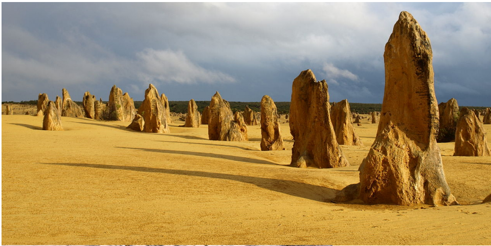
The Pinnacles Desert_