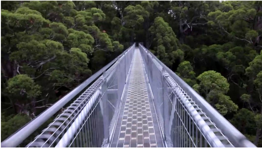
Margaret River region's caves_